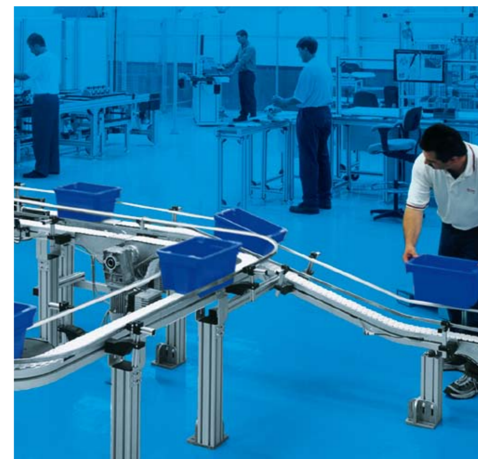
Транспортировка контейнеров в упаковочном производстве

Для изделий любой формы Благодаря новой модульной системе можно транспортировать изделия неправильной формы. Несущие элементы системы могут иметь различные исполнения и могут быть приспособлены для изделий различных размеров и под различные применения. Данная система расширяет спектр применения VarioFlow и позволяет при этом сэкономить время и средства.