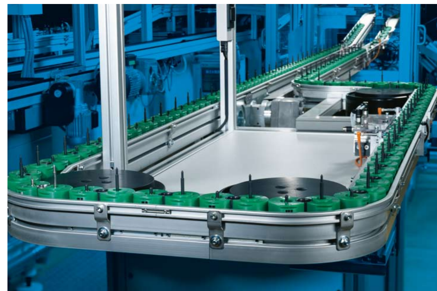
Транспортировка в производстве электродвигателей